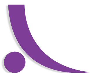
SCHÉMA DE PROMOTION DES ACHATS RESPONSABLES DE LA BANQUE DE FRANCE