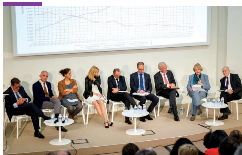
Rencontres régionales et européennes du microcrédit - 20 octobre 2017

Complétées en 2018 d'actions ciblées de niveau départemental