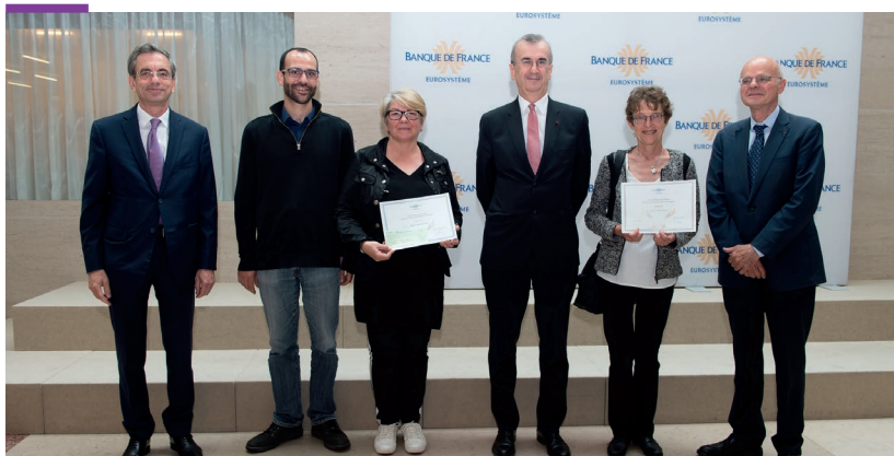
Conférence de presse du 12 juin 2018