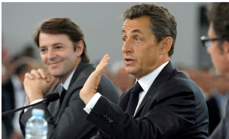
Coup d'arrêt. Nicolas Sarkozy et François Baroin, alors ministre de l'Économie, en 2011.