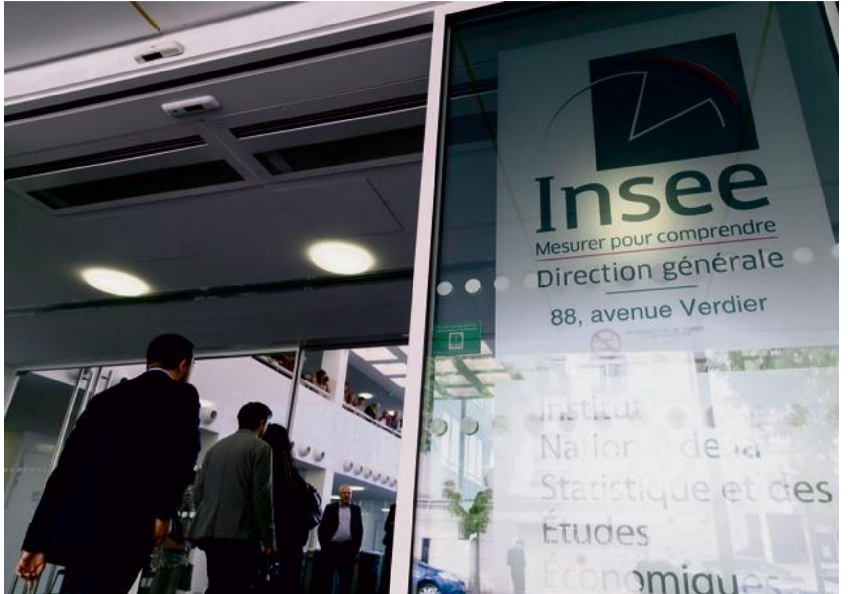
Lors de l'inauguration du nouveau siège de l'Insee, à Montrouge (Hauts-de-Seine), en octobre 2018.