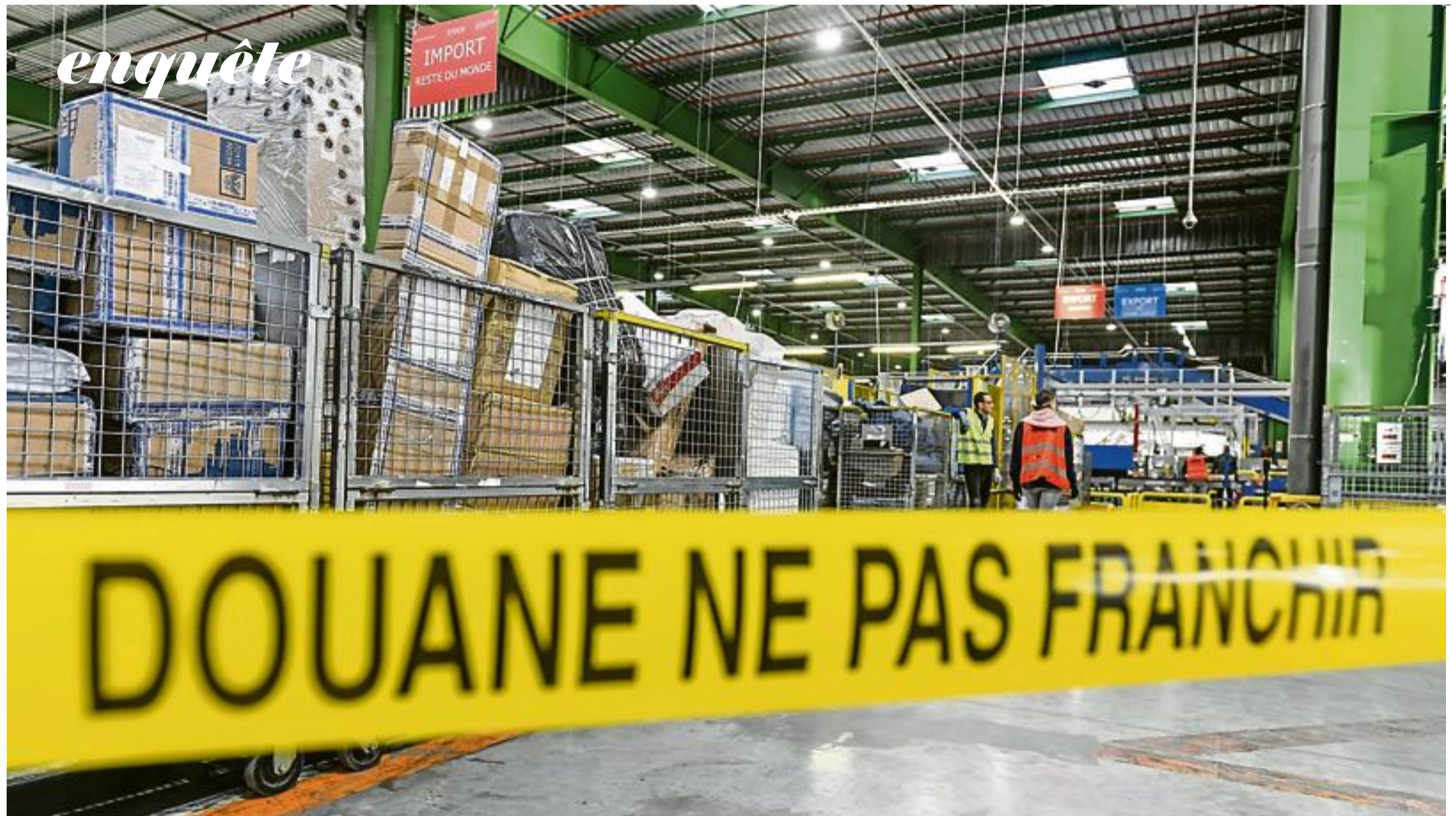
Un produit importé valant moins de 22 euros est exonéré de TVA. Dans les prises des douaniers, on ne compte plus le nombre de smartphones, guitares ou robes de mariée qui ont été déclarés comme un bien de valeur inférieure à cette somme.