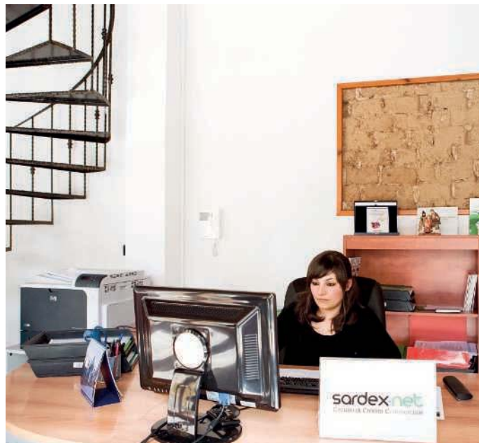
Au siège de Sardex, à Serramanna. Le credo du réseau : « Changer la façon dont on fait du crédit dans le monde entier. »

➔ quelques centaines d'euros par an, selon la taille de votre activité), votre solde est de zéro. Si vous achetez quelque chose à une autre entreprise du réseau, votre compte devient négatif (et, techniquement, de la monnaie est alors créée). Aucun intérêt n'est prélevé pour ce « découvert » : votre seule obligation est de sortir du rouge, en vendant à votre tour quelque chose en sardex, dans un délai raisonnable (douze mois). Si vous avez besoin d'un bien ou d'un service précis, vous pouvez téléphoner à l'un des 16 « brokers » de Sardex, qui connaissent bien le réseau des 3 500 membres et qui vous aideront à le trouver. Ainsi l'ensemble des comptes du réseau s'équilibre : Sardex fonctionne comme une chambre de compensation entre des crédits et des débits. Seules les entreprises ont accès au réseau, mais elles peuvent distribuer des sardex à leurs employés, en complément de salaire.