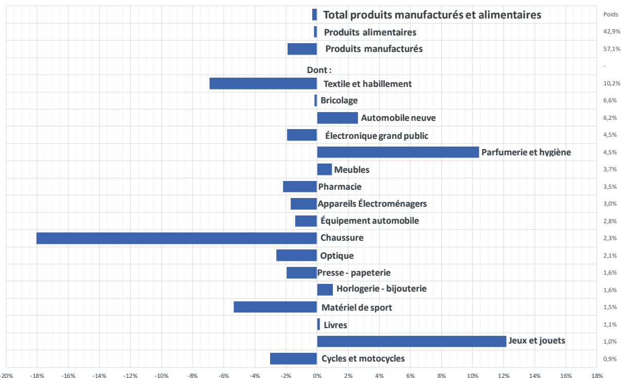
Total des ventes de produits manufacturés et alimentaires : variations M/M-1 (%) Évolution mensuelle ; volume CVS-CJO.

Sur les trois derniers mois par rapport aux trois précédents, la diminution de -1,5 % de l'ensemble des ventes est due à celle des produits manufacturés (-3,0 %), tandis que celle des produits alimentaires est plus modérée (-0,8 %).